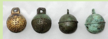
諏訪市有形文化財 小丸山古墳出土品