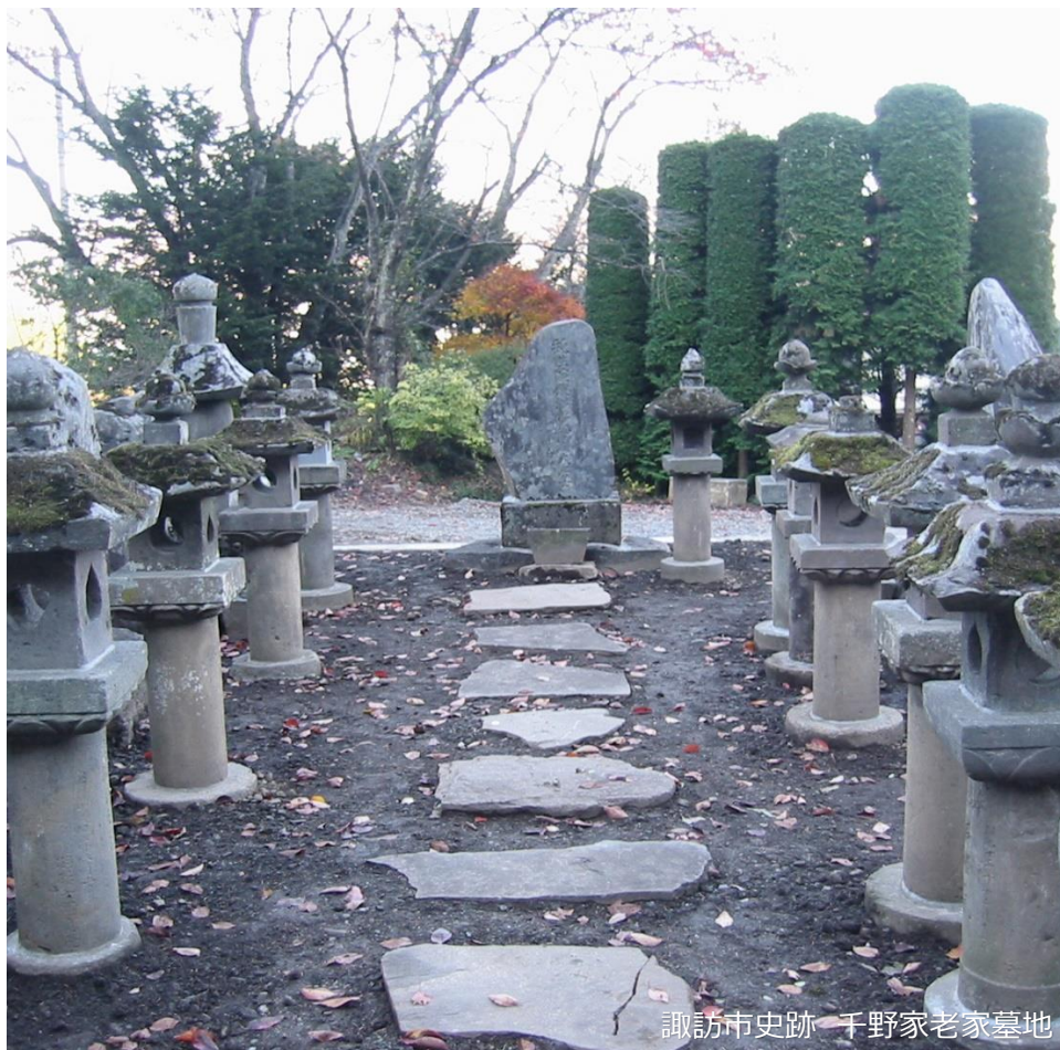
諏訪市史跡 千野家老家墓地