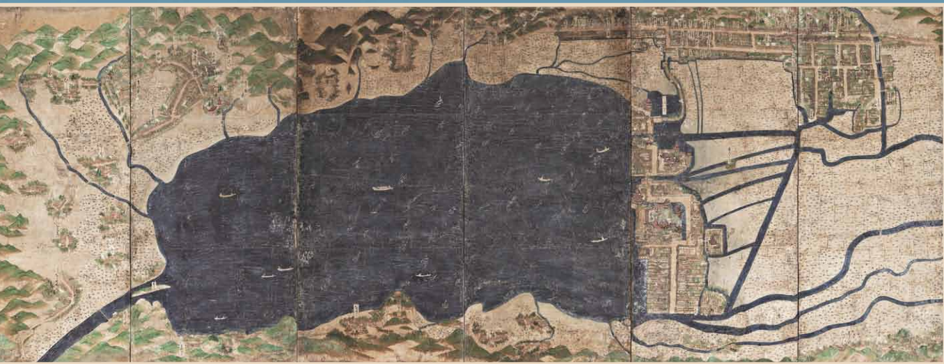
御秋原画(左) 諏訪市有形文化財 八鏡神社所有・当館寄託