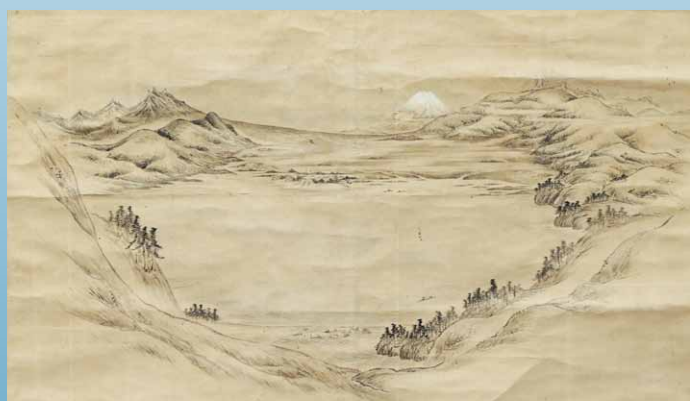
諏訪城遠望図 (渡辺斧蔵 筆)