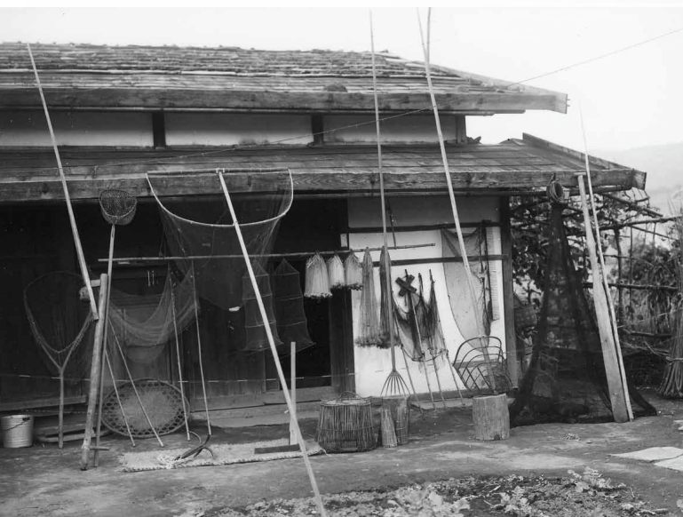
さまざまな漁具 (昭和16年撮影)